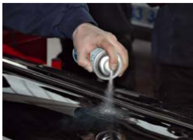
...und gleich darauf extrem abgekühlt.