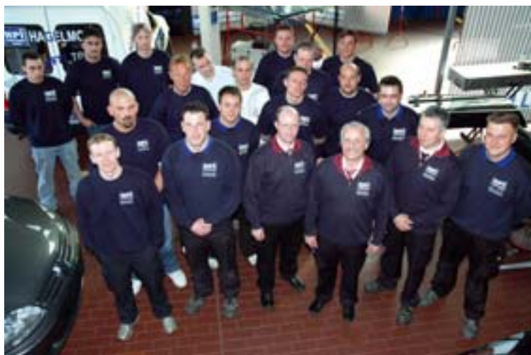
Das HPI-Team ist gut auf die kommende Hagelsaison vorbereitet.

Weitere Informationen: HPI-Zentrum GmbH Tel: 07033/ 309372 www.HPI-Zentrum.de