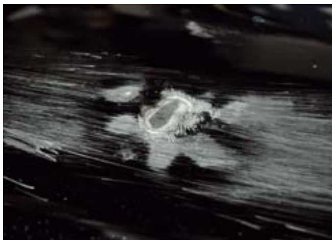
Das Ergebnis: Eine Oberfläche, die der Lackierer weiterbearbeiten kann.