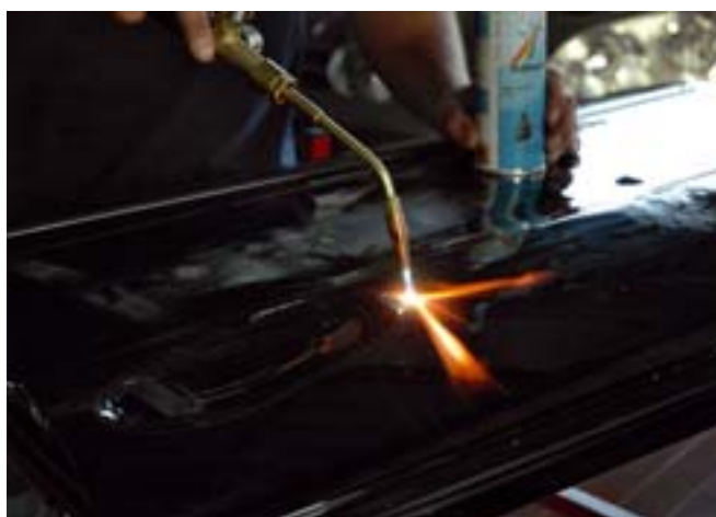
Erst wird das Blech mit der Flamme erhitzt...

Welche Aufgabenteilung sprechen Sie da an?