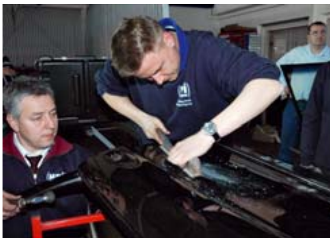
Anschließend kommen Hammer (Bild oben) und Karosseriefeile zum Einsatz.